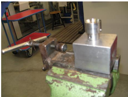
Abb.3 Montagevorrichtung für O-Ringteller