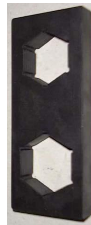
Abb.1: Montagehilfe für 6-kant Eintrittskörper