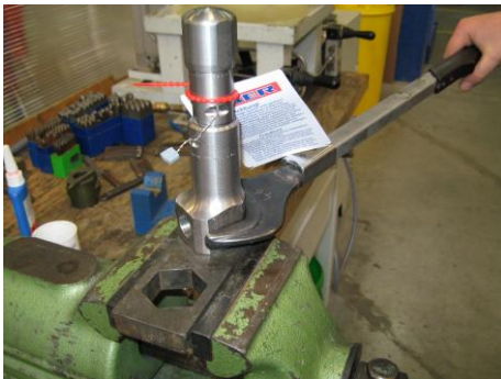
Abb.1 Montage des CP