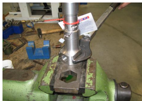
Abb.4 Montage des Austrittskörpers mit einem fest definierten Drehmoment