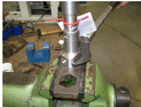
Abb.2 Montage des CP