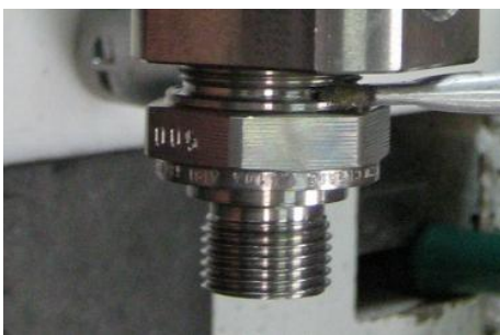
Abb.3 Montage der Eintrittskörpers